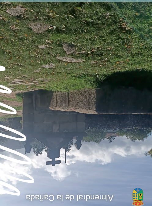
Almendral de la Cañada