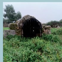
Fuente de Prao Pozo