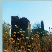
Iglesia de San Salvador