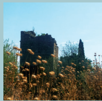
Iglesia de San Salvador