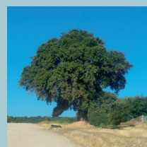
Encina la Jarderosa

También cabe destacar el sagrario de piedra, la capilla gótica lateral y el espectacular arco de piedra tallada de la puerta de entrada.