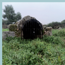
Fuente de Prao Pozo