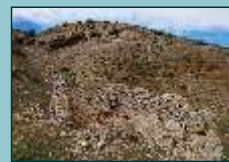
Ermita de Ntra. Sra. del Socorro

Su fundación (s. XII) está relacionada con la Orden de Calatrava. Se encuentra en el límite municipal con Huerta de Valdecarábanos y su estado ruinoso desde el s. XVIII se debe más a disputas entre ambos municipios que al paso del tiempo.