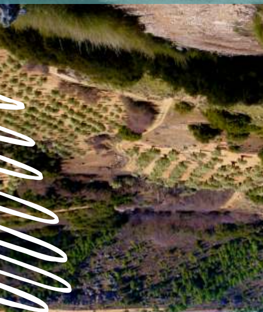
Cabañas de Yepes