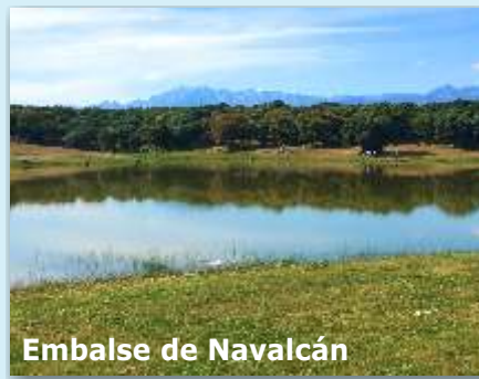
Embalse de Navalcán