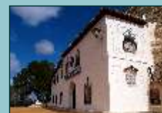
Ermita del Santo Niño

A principios del s. XVI se construye un convento de frailes trinitarios. Desde sus orígenes este peculiar santuario ha sido visitado por monarcas e ilustres y notables personajes históricos.