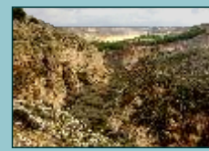
Barranco de la Cuesta del Carrizal

En el extremo este una pronunciada pendiente nos lleva desde la altiplanicie al valle por un barranco con bruscos escarpes yesíferos. La erosión del agua y el viento modela cárcavas y peculiares formaciones que están en constante y aleatorio cambio.