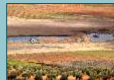
La Laguna y el observatorio de aves