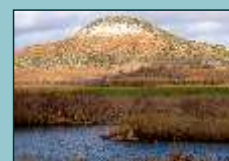
La Laguna y el cerro de Las Maricas

Cerca de las lagunas se encuentra el cerro de Las Maricas, peculiar formación geológica denominada "cerro testigo", consistente en una elevación con forma cónica que ha quedado aislado en el paisaje debido a la fortaleza de sus estratos, después de haber sido erosionados los materiales sedimentarios a su alrededor.