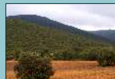
Finca de la Estrella