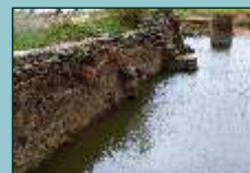
Presa romana Valhermoso