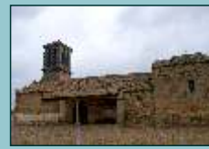
Iglesia de Casalgordo

Posteriormente, los restos demuestran la presencia de romanos (siglos II al IV d. C.), población hispano-visigoda (siglos VII-VIII) y musulmana, quienes finalmente se asentaron sobre los antiguos poblados romano y visigodo en los siglos IX al XI, hasta que esta zona fue abandonada por los moradores árabes, al ser reconquistado Toledo y su comarca.