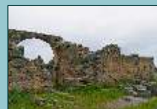
San Pedro de la Mata