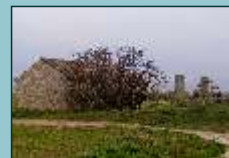
Paraje La Mezquitilla